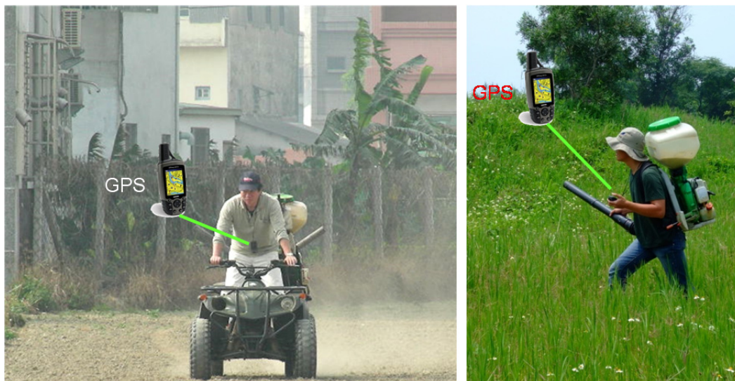
圖一 入侵紅火蟻防治施藥器具：改良自沙灘車之施藥器具（左圖）及背負式施藥器具（右圖）。

入侵紅火蟻之偵察為防治成功與否之關鍵，北臺灣目前是入侵紅火蟻主要發生區；防治計畫之初，火蟻防治中心在北臺灣之桃園地區，進行每年兩次之大面積偵察，範圍涵蓋北臺灣之桃園及其周遭地區；而大面積之全面施藥也是防治之初的防治模式，為了讓防治藥劑能有效及均勻的施撒在入侵紅火蟻發生區，火蟻防治中心會依據蟻丘所在地繪製工作地圖，工作地圖涵蓋蟻丘位置及其周遭約五十公尺範圍之區域，作為防治範圍；而防治隊員也配戴有 GPS，並根據工作地圖涵蓋範圍進行施藥；為了因應臺灣之特有地形，火蟻防治中心也修改數款沙灘車作為入侵紅火蟻防治施藥器具（圖一），有些沙灘車無法到達地區，如公園、山區斜坡、農田溝渠等，則防治隊員會改用背負式施藥器具進行施藥（圖一）。入侵紅火蟻的防治期程為大面積每年施藥二至四次，IGR 及毒殺性藥劑交替使用，投藥劑量因藥劑種類不同而有所差異。除了大面積施藥外，緊急防治也是火蟻防治中心主要業務之一，某些敏感區域（如小學、公園）及入侵紅火蟻新發生區，蟻丘直接灌注藥劑是常用方法，可以快速直接移除可見蟻丘。藥劑灌注之後，通常於蟻丘周圍再撒布藥劑，以消滅潛在未被偵測到的入侵紅火蟻蟻丘。