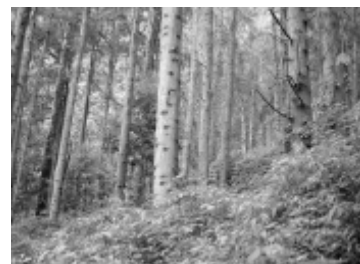
照片 23 SBE = 47.05