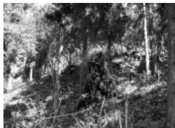
照片 3 SBE = -122.06