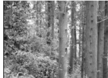
照片 11 SBE = -57.02