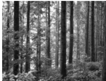
照片 19 SBE = 57.32