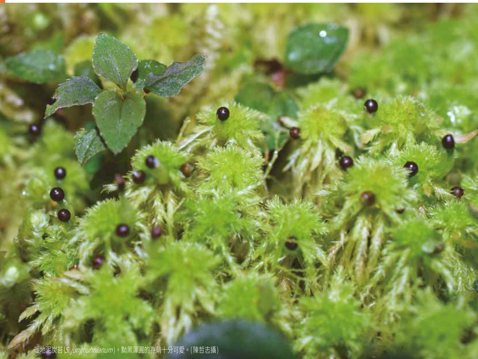
暖地泥炭苔 ( S. junghuhnianum )，黝黑渾圓的孢蒴十分可愛。