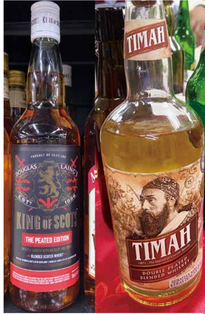
利用泥煤(peat)烘烤過的大麥所製成的泥煤威士忌以獨特的香氣著名

在日常生活印象中，相較於常見的花草樹木，苔蘚植物似乎總是在周遭的陰暗處悄悄地滋養生息，附生於樹幹上、花圃間、甚至是人行道的縫隙，扮演著楚楚動人的小精靈。然而泥炭苔作為苔類植物門(Bryophyta)的一員，卻霸道地運用了特別的生物特性為自己量身打造出不利於大多數植物生長的水苔沼澤，不僅創造出世界上獨一無二的生態系，更影響了地球的碳循環；除此之外，泥炭苔在人類歷史及經濟活動中也佔有一席之地。如果有種過蘭花或鹿角蕨，就一定有使用過泥炭苔！