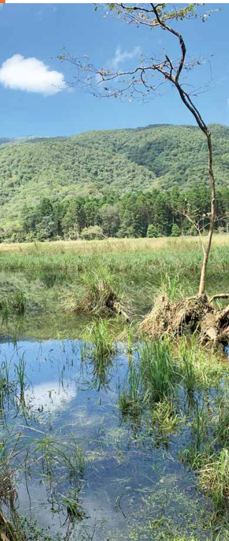
草埤坐落在哈盆山地稜脈，四周有原始林及次生林圍繞。