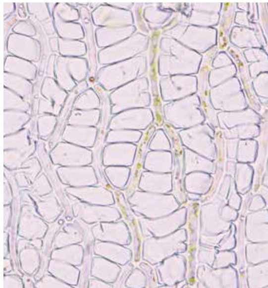
泥炭苔植物細胞裡有著許多大大小小的透明細胞，能夠吸收相當於自身體重二十倍的水分。

泥炭苔體內透明的死細胞占了植物體絕大部分的面積，細窄的活葉綠細胞穿梭其中，像是一個極為精細的織網，共同架構成儲水能力極強的莖和葉片；這一個個小小的儲水腔室聯合起來，使得泥炭苔能夠吸收相當於自身體重二十倍的水分。加上其柔軟的質地，可說是許多微小生物們的豪華公寓，許多細菌在這些空腔中進行著不同的化合物轉換，例如將空氣中的氮氣轉化為其他生物可利用的氮源；而真菌則通常扮演分解者的角色，將大分子殘骸分解後產生的各類養分，以供棲息其間的生物利用，儼然形成了一個自給自足的小生態系。筆者曾於泥炭苔體內分離出多樣的真菌，而某些種類的真菌還會從苔的身上默默地冒出菇來，在欣賞泥炭苔的美麗時也可觀察到這般獨特和諧共存的現象，不禁讓人佩服大自然的美妙。