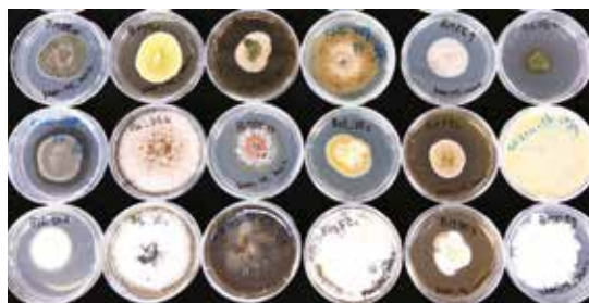
從泥炭苔植物體中分離出各種各色豐富的真菌