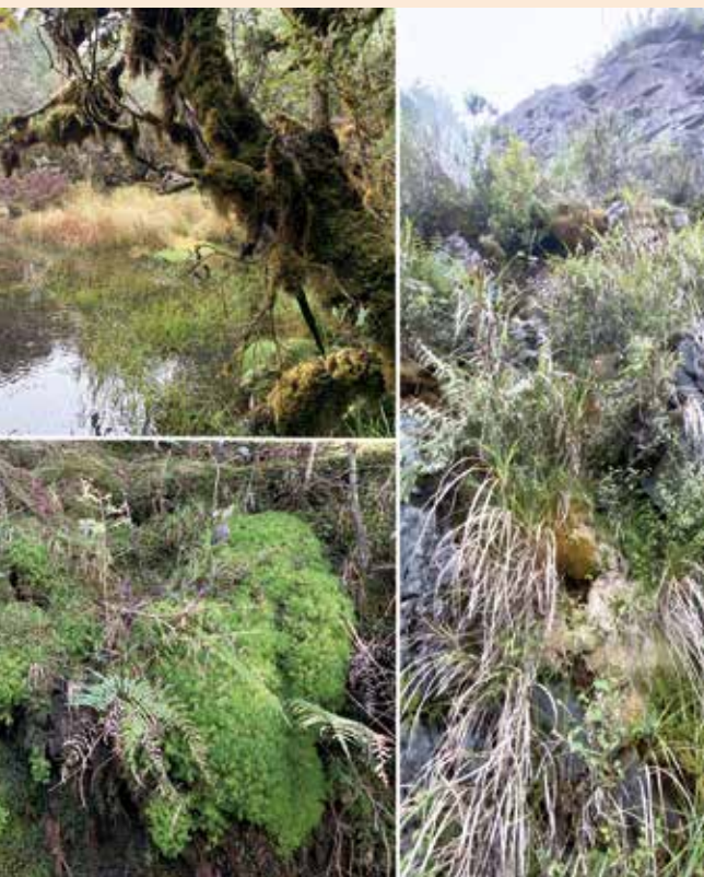
泥炭苔屬植物在台灣的棲息地相當多元，從森林底層、石壁邊坡到山中沼澤都可發現其蹤影。

佈著泥炭苔倩麗的身影；其中翠峰湖環湖步道具有很高的泥炭苔多樣性，不同於一般常見的蘚苔植物的翠綠，泥炭苔顏色像是一朵朵爭奇鬥艷的小花般千變萬化，其顏色受到種類以及環境的影響變化；尤其到了秋冬，各種泥炭苔色彩繽紛，從橘色的擬狹葉泥炭苔( S. cuspidatum )、紅紫色的美神泥炭苔( S. divinum )、帶點金棕色的泥炭苔( S. palustre )、或翠綠的白齒( S. girgensohnii )及暖地泥炭苔( S. junghuhnianum )，各種顏色互相輝映之下，薄霧籠罩的湖畔顯得更加美麗且饒富趣味。