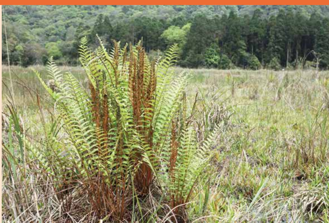
草埤為分株假紫萁在台灣的少數野外棲地

說全部仰賴進口；但是在過去曾有日人大量收購台灣濕地泥炭苔的紀錄。近年來基於蘚苔微景觀和室內小型造景的風氣興起，一方面激起了民眾對蘚苔類植物的興趣與研究，但同時也增加了愛好者為了追求稀有或特殊性而去採摘台灣本地泥炭苔的可能。由於泥炭苔需要生長在潮濕的環境，在台灣野外目前的生長環境受到十足的限制，氣候變遷帶來的乾旱、山林沼澤陸化，及棲地破壞影響的水文分佈；人為開發或風災引起的地形變化，都會對台灣野生泥炭苔族群的生存帶來嚴厲的挑戰。