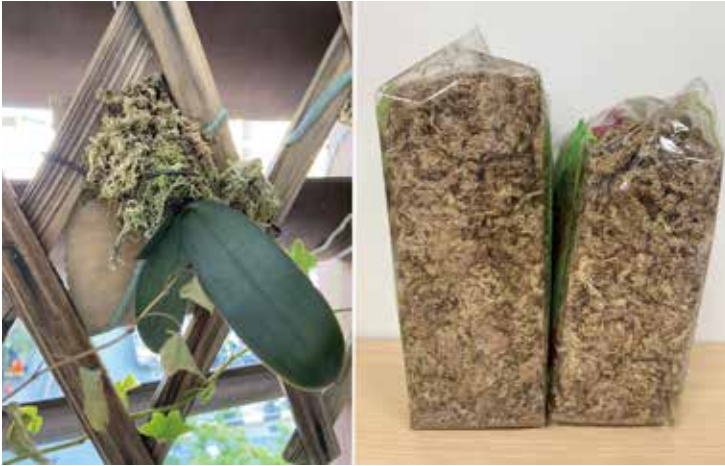
園藝上常用來保水的水苔，其實就是泥炭苔的一種。