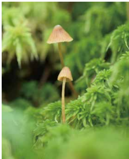
從泥炭苔植物長出盔孢傘屬的真菌子實體 ( Galerina sp.)