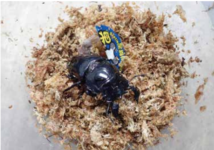
保濕又不易發霉的水苔，很適合拿來當昆蟲飼養的墊料。