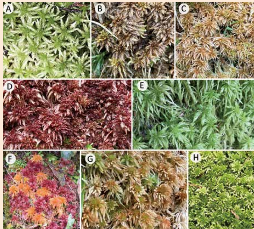
在太平山色彩繽紛的泥炭苔；(A-C) 翠綠到帶有金棕色的泥炭苔 ( S. palustre )。 (D) 紅紫色的美神泥炭苔 ( S. divinum )。 (E) 翠綠的白齒泥炭苔 ( S. girgensohnii )。 (F) 紅紫色的美神泥炭苔與橘色的擬狹葉泥炭苔 ( S. palustre & S. cuspidatum )。 (G) 橘棕色的擬狹葉泥炭苔 ( S. cuspidatum )。 (H) 黃綠色的暖地泥炭苔 ( S. junghuhnianum )